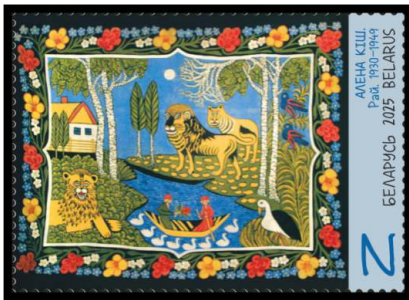
Алена Кіш. Рай. 1930–1949 (Алёна Киш. Рай. 1930–1949)