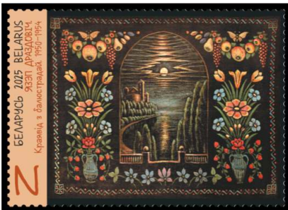
Язэп Драздовіч. Краявід з балюстрадай. 1950–1954 (Язэп Дроздович. Пейзаж с балюстрадой. 1950–1954)