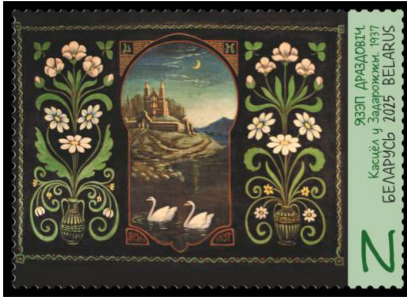
Язэп Драздовіч. Касцёл у Задарожжы. 1937 (Язэп Дроздович. Костел в Задорожье. 1937)